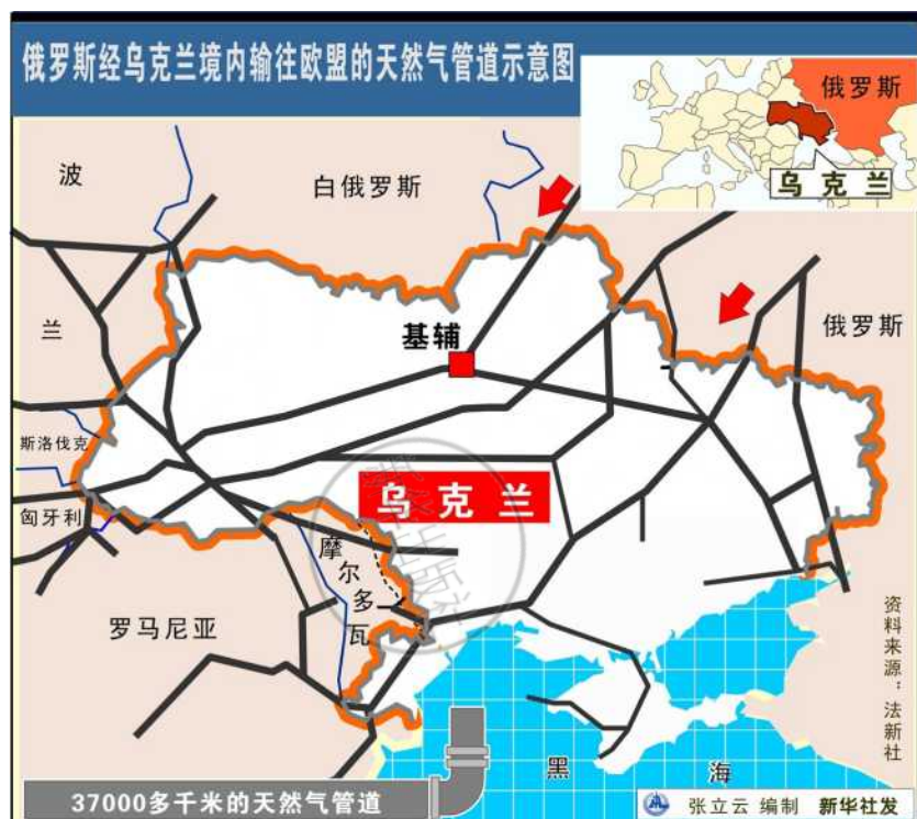
俄罗斯经乌克兰境内输往欧盟的天然气管道示意图。

气，进口量仅为3年前的四分之一。而乌总理阿扎罗夫也曾表示，如果乌克兰不能就天然气定价问题与俄方达成一致，乌克兰可能在未来数年内彻底停止从俄罗斯进口天然气。