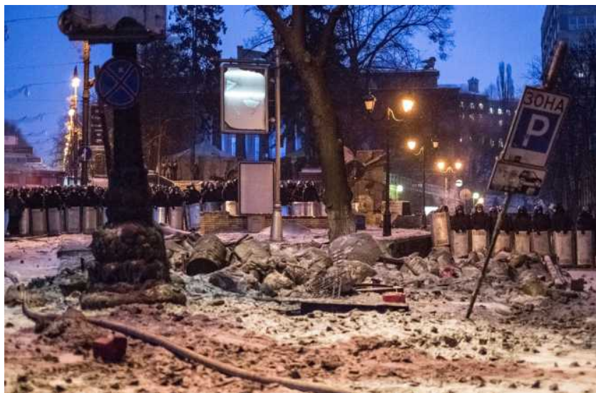
2014 年 1 月 23 日，在乌克兰首都基辅市中心，警察严阵以待。