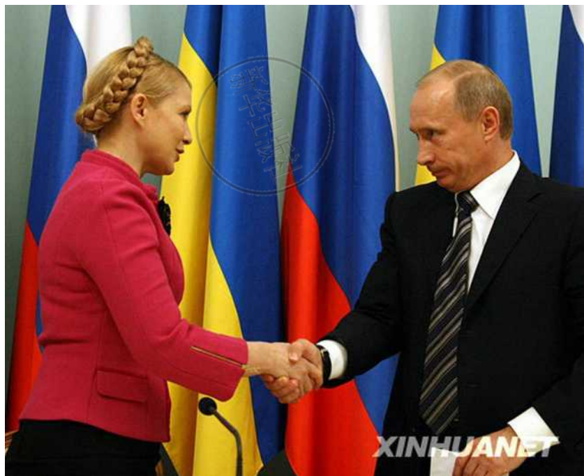
2009 年 1 月 19 日，俄罗斯总理普京（右）与乌克兰总理季莫申科在天然气购销合同签署仪式上握手。

月 19 日的协议在欧盟斡旋和双方各有让步的基础上达成，俄方同意 2009 年对乌供气价格将在欧洲价格基础上给予 20% 的折扣，而乌方同意 2009 年俄过境乌对欧洲输气的费率维持 2008 年标准不变，总体上考虑了各方利益。但尤先科对此却颇不以为然，甚至于 2 月 10 日主持召开的国家安全与国防委员会会议上，当面公开指责季莫申科总理和普京签署的俄乌天然气协议是真正出卖国家利益的犯罪行为，季莫申科则在反唇相讥后愤而离场。尽管府、院双方抵牾不绝，但 2008 年 12 月新组建的执政联盟一直勉强维持到 2010 年总统大选之后。