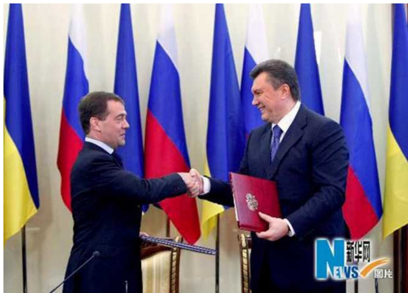
2010 年 4 月 21 日，乌克兰总统亚努科维奇和俄罗斯总统梅德韦杰夫在哈尔科夫交换协议文本后握手。

长 25 年至 2042 年，并且在该期限届满后双方还可决定是否再延长 5 年。4 月 27 日，乌克兰最高拉达就俄罗斯黑海舰队驻扎问题进行讨论时出现混乱，数千人在议会外示威，议会内有人施放烟雾弹，但该议案最终以 236 票的微弱多数获得通过。