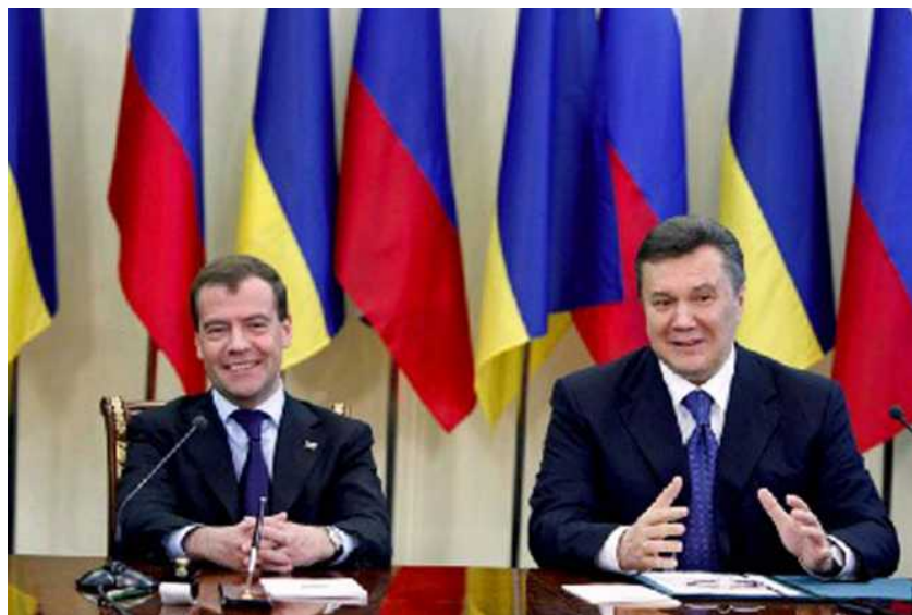
2010年4月21日，乌克兰总统亚努科维奇和俄罗斯总统梅德韦杰夫在哈尔科夫交换协议文本后握手—2。

发了乌克兰国内的激烈对峙，中西部民众表示坚决反对，东南部民众则普遍拥护。尽管利特温以辞去议长职务相抗议，亚努科维奇仍然于8月8日签署了法案。